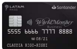
WORLDMEMBER BUSINESS SANTANDER LATAM PASS