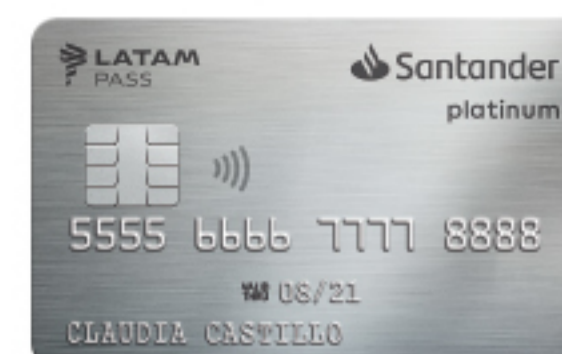
PLATINUM SANTANDER LATAM PASS