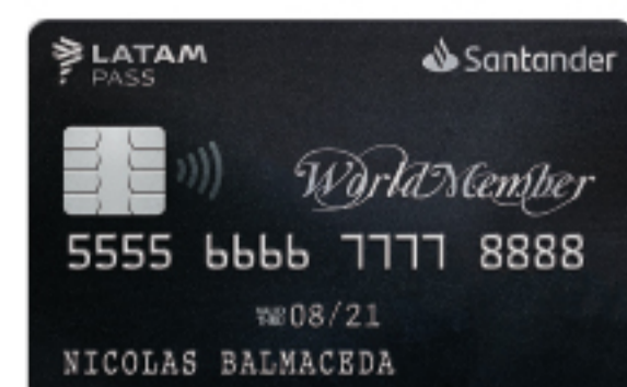
WORLDMEMBER SANTANDER LATAM PASS