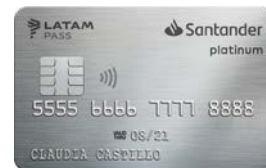
PLATINUM SANTANDER LATAM PASS