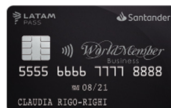
WORLDMEMBER BUSINESS SANTANDER LATAM PASS