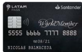
WORLDMEMBER SANTANDER LATAM PASS