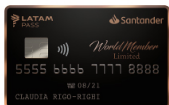
WORLDMEMBER LIMITED SANTANDER LATAM PASS