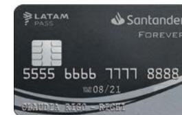
FOREVER SANTANDER LATAM PASS