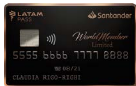
WORLDMEMBER LIMITED SANTANDER LATAM PASS