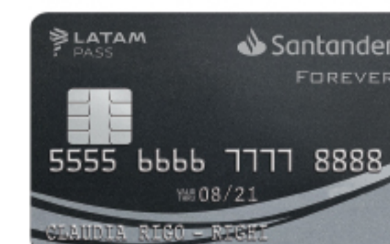
FOREVER SANTANDER LATAM PASS